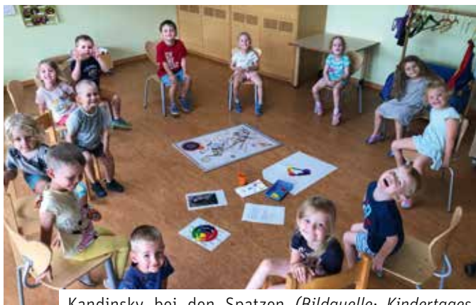
Kandinsky bei den Spatzen