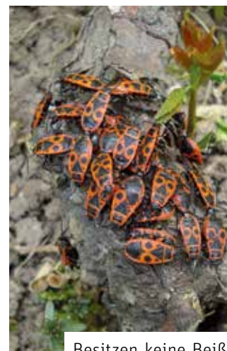
Besitzen keine Beißwerkzeuge – Feuerwanzen