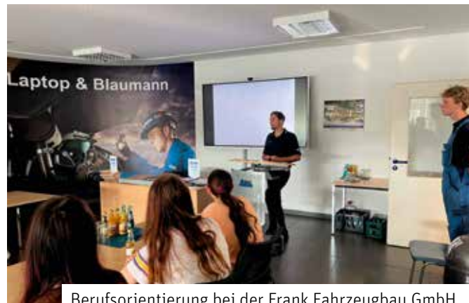
Berufsorientierung bei der Frank Fahrzeugbau GmbH

Ein herzliches Dankeschön an die bisherige Unterstützung: Frank Fahrzeugbau GmbH, Mobau Moderner Baubedarf GmbH, Buderus Thermotechnik GmbH, Kornsign, Heinrich Schmid GmbH & Co. KG, Arbeitsagentur, Veolia Klärschlammverwertung Deutschland GmbH, Sparkasse Leipzig KG, Sächsische Haustechnik, Umwelttechnik und Wasserbau GmbH, AWO Sachsen-West, G & B Zentralheizungs- und Sanitärbaubau GmbH, Mingzhi Technology Leipzig GmbH, Allianzvertretung Jana Wiehmann, IKK classic, Fachbereich IV-Wirtschaftsförderung, Stadtmarketing, Schulen und Kultur