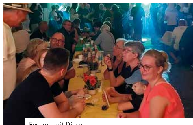
Festzelt mit Disco

Bogenschießen, Büchsenzielwurf, Ballspielen, Federball, Hüpfburg u. a.