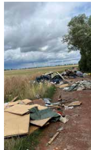
Ablagerung im Knautnaundorfer Weg

Mit freundlichen Grüßen Roland Vitz, Ortsvorsteher