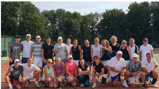
Viele glückliche Gesichter am Ende eines gelungenen Vereinsturniers