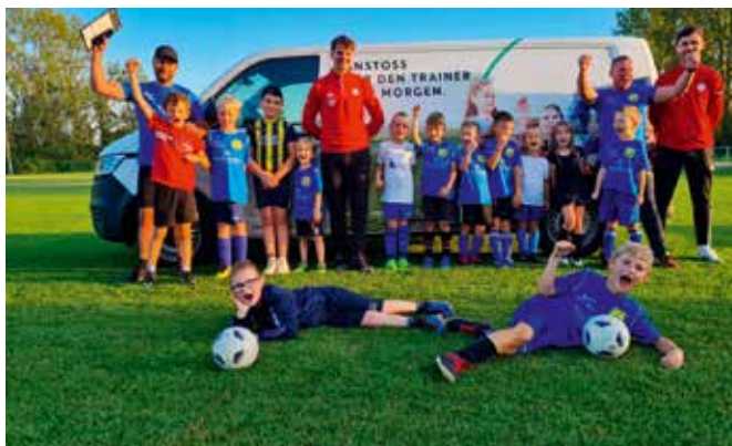
Fröhliche Kinder nach einem intensiven Training mit dem DFB-Mobil