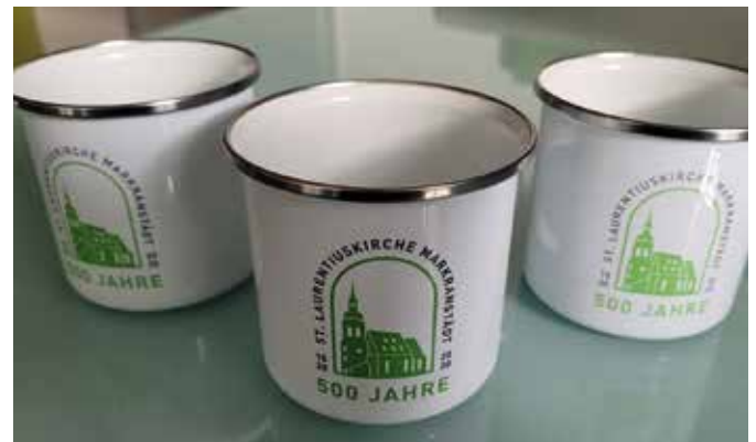
Eine St. Laurentiustasse als Dankeschön für die Teilnahme am STADTRADELN 2023