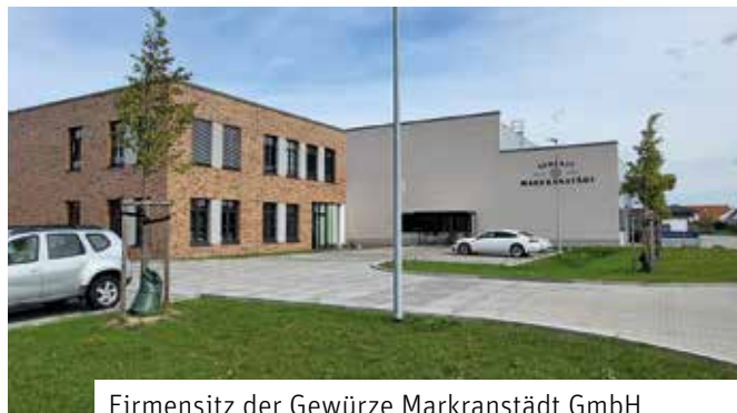
Firmensitz der Gewürze Markranstädt GmbH

Das MGH lädt Neugierige jeden Alters ein.