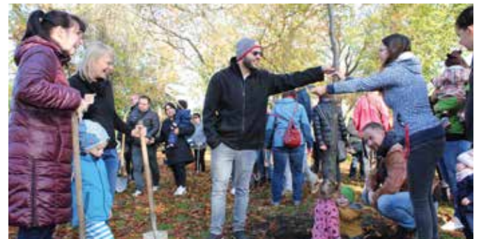
Jahrgangspflanzung 2022 in Markranstädt

Einer alten Tradition folgend wird zur Begrüßung der Neugeborenen in Markranstädt ein Lebensbaum gepflanzt. Auch in diesem Jahr lädt die Stadtverwaltung gemeinsam mit den Ortschaftsräten für den Jahrgang 2022 zur Pflanzung am 4. November 2023 ein. Ab 10 Uhr werden dann in jeder der sechs Ortschaften Erdlöcher ausgehoben, die Bäume eingesetzt und mit den ersten Wassertropfen angegossen. Seit 2009 wurden auf diese Weise rund 650 Bäume in der ganzen Stadt gepflanzt. Die glücklichen Eltern der 100 Markranstädter Neubürger erhalten eine separate Einladung mit dem jeweiligen Pflanzort. Als Erinnerung wird dem Kind zudem eine Urkunde ausgestellt sowie ein kleines Geschenk überreicht. Wer möchte, kann ebenfalls den Namen auf der Jahrgangstele abdrucken lassen.