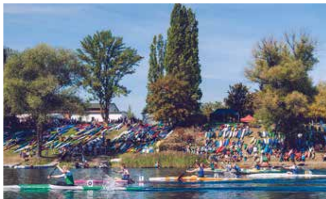
859 Sportler aus 31 Vereinen nahmen an der 7. Kanu-Regatta teil

Vom 09. bis 10. September 2023 fand die siebte Neuauflage unserer Regatta am Kulkwitzer See statt. Bei perfektem Kaiserwetter fanden sich 859 Sportler aus 31 Vereinen am Westufer des Kulkwitzer Sees ein. Die wieder gestiegene Teilnehmerzahl, trotz Beschränkung auf 700, stellte uns natürlich vor neue Aufgaben. Es fällt halt doch schwer, jemandem abzusagen. Auch die eine oder andere logistische Panne musste im Vorfeld gemeistert werden. Aber genau das macht die berühmte Sieben ebenso spannend. Ab Freitag 15 Uhr reisten die ersten Vereine auf dem Zeltplatz an. Innerhalb kürzester Zeit entstand eine kleine Zeltstadt. Dank guter Vorbereitung und Absperrung der einzelnen Parzellen verlief die Anreise reibungslos.