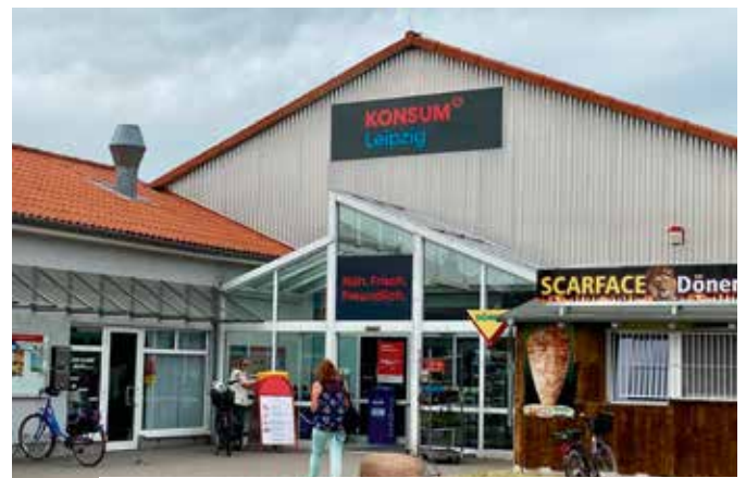
Konsum Großlehna: Leider seit 12. August geschlossen