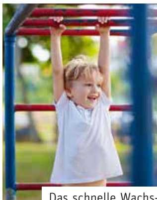
Das schnelle Wachstum von Kindern ist eine gewaltige Aufgabe für Knochen, Sehnen und Bänder: Viel Bewegung und Hilfe aus der Natur unterstützen dabei.

Stundenlang durch Wald und Wiesen strömen, im Hof Gummitwist oder Himmel und Hölle spielen, Höhlen bauen, Schaukeln, Bolzen, Klettern und vieles mehr: So haben die meisten Kinder früher ihre Nachmittage verbracht. Heute spielt körperliche Aktivität bei den Jüngsten eine immer geringere Rolle. Spätestens mit dem Schuleintritt geht die Bewegungshäufigkeit zurück – laut einer Studie der Universität Heidelberg sitzen schon Grundschul Kinder bis zu zehn Stunden am Tag. Die zunehmende Beschäftigung mit Smartphone und Co. trägt ebenfalls dazu bei. Dabei fördert jeder Schritt und jeder Sprung den Knochenaufbau und die gesunde Entwicklung des Bewegungsapparates.